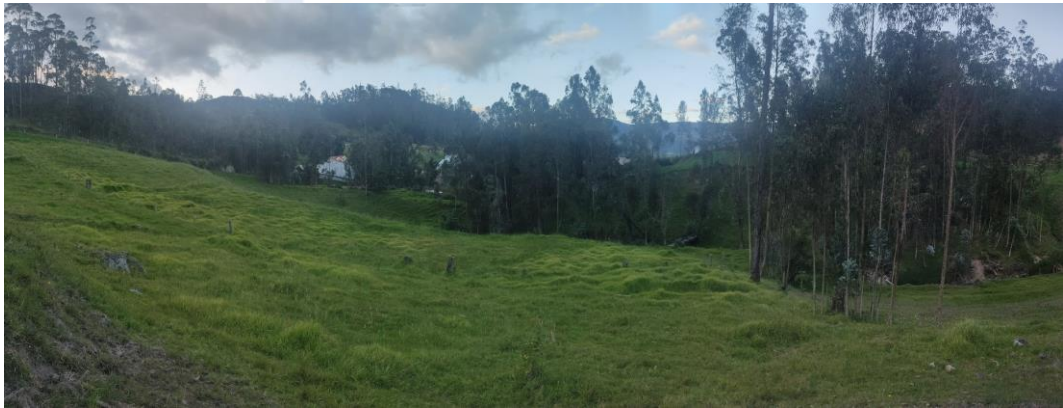
Fotografía No. 04. Depreciaciones en el terreno adjunto al de la PTAR No. 02