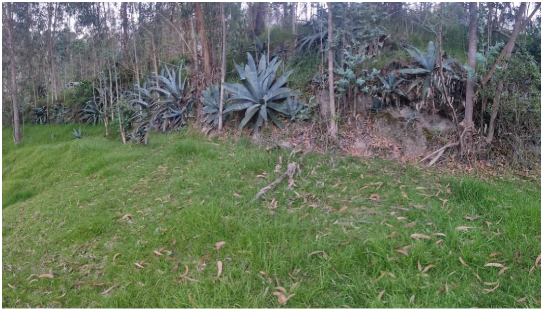
Fotografía No. 01. Escarpe en la zona superior del terreno de la PTAR No. 01