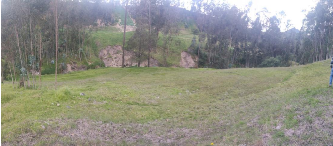
Fotografía No. 02. Escarpes antiguos en el terreno de la PTAR No. 02