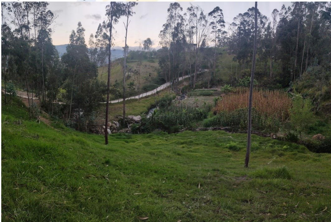
Fotografía No. 02. Depresiones en el terreno de la PTAR No. 01